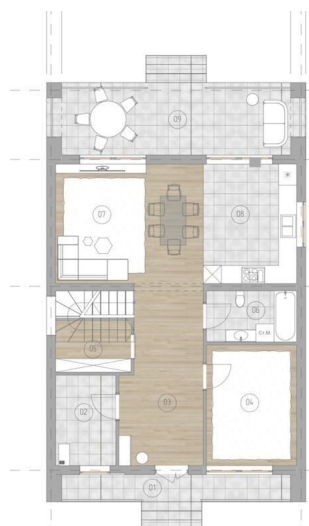
Экспликация 1-й этаж