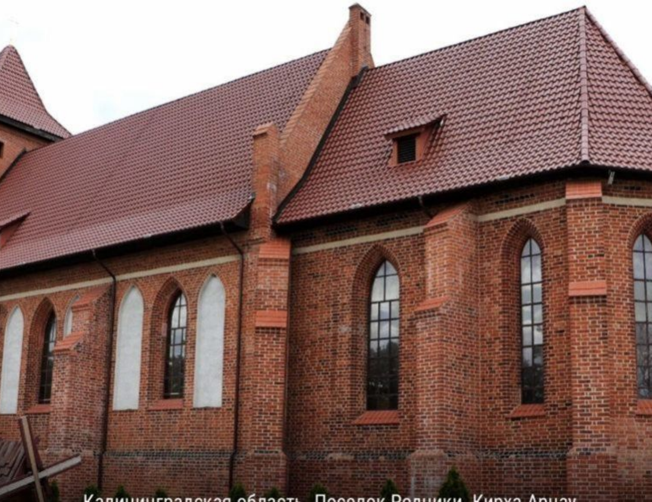
Калининградская область, Поселок Редники, Курья Арцеу