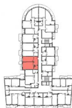
АПАРТАМЕНТЫ №108, 124, 140 ПЛАН 3ГО, 4ГО И 4ГО ЭТАЖЕЙ СЕКЦИИ №8