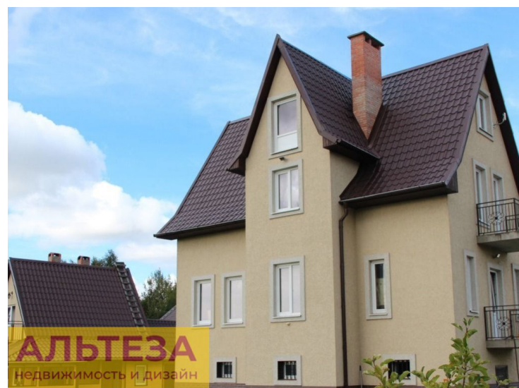
АЛЬТЕЗА недвижимость и дизайн