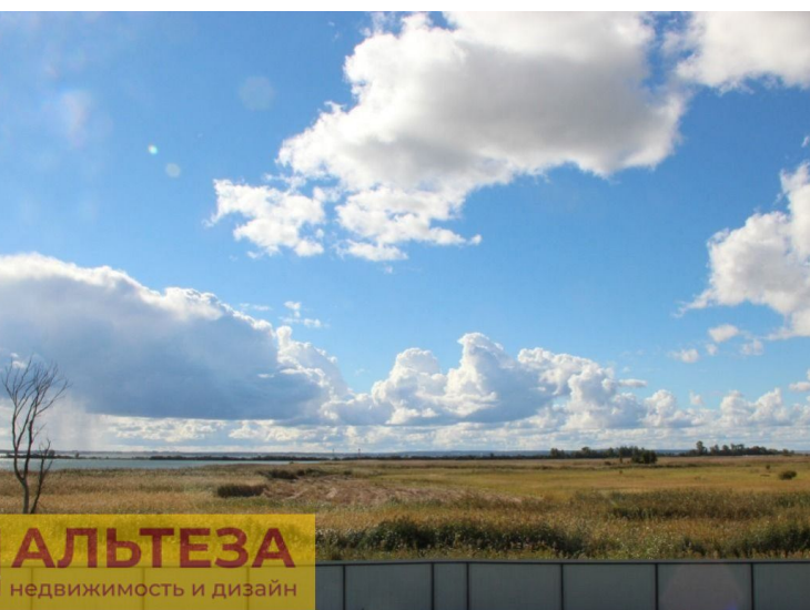
АЛЬТЕЗА недвижимость и дизайн